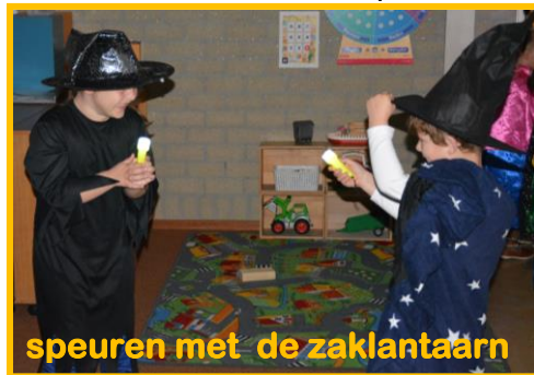
speuren met de zaklantaarn